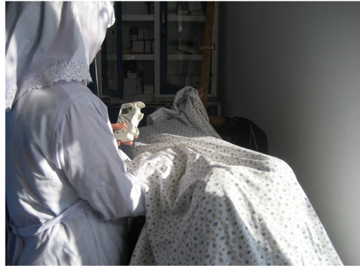
Chadija untersucht eine Patientin