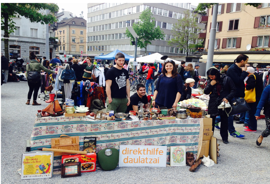
Der Flohmarkt auf dem Kanzleiareal im Frühling 2014

Das erste Mal hat der Verein Direkthilfe Daulatzai im Mai 2014 am Flohmarkt auf dem Kanzleiareal in Zürich zugunsten des Vereins eine Vielzahl Kleider, Hausrat, Schmuck und Bücher verkauft, die von einer Gönnerin des Vereins gespendet wurden. Dieser Anlass war ein voller Erfolg, weshalb im September 2014 ein weiterer Flohmarkt durchgeführt wurde. Insgesamt kamen durch den Flohmarkt CHF 1224.80 für den Verein zusammen.