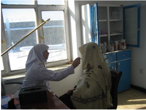
Chadija bei der Arbeit

die Anliegen und Informationen der Ambulatoriumsmitarbeiter auf Englisch und leitet sie an den Vereinsvorstand in der Schweiz weiter.