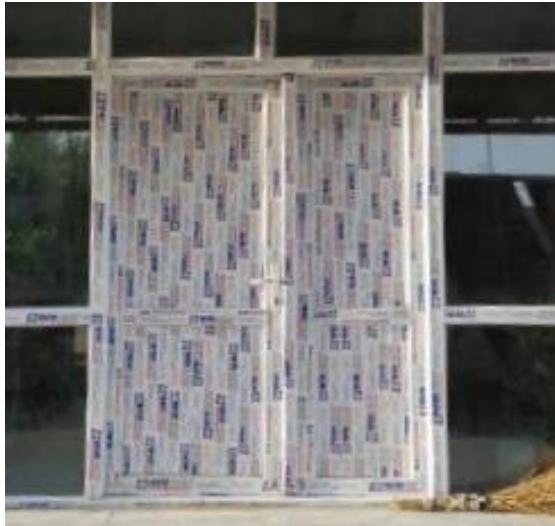
Front-Türe des Ambulatoriums im Reparatur-Prozess, Sommer 2018

Die Infrastruktur des Ambulatoriums muss mit den heißen Sommern und nass-kalten Wintern der ost-afghanischen Region Paktia einiges aushalten. Im Sommer 2018 wurden daher reparaturbedürftige Fenster und Türen am Ambulatorium durch neue, robustere Türen und Fenster ersetzt. So war das Ambulatorium für den bevorstehenden Winter gerüstet.